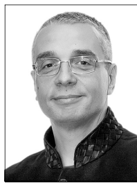
Сергей ГОЛУБИЦКИЙ специально для «Новой»

Посмотрим теперь, как обстоят дела с реализацией 5G на практике. Летом 2018 года катарский оператор Ooredoo первым